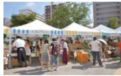
美浜マルシェ&屋外ステージ(イメージ)