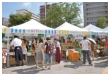
美浜マルシェ&屋外イベントエリア