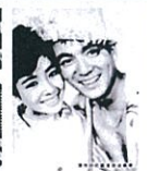
大学の若大将 君も出世できる