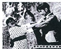
エノケンのガンバリ戦術

35mmフィルム上映で懐かしの映画の数々をお楽しみいただける映画会を、若葉文化ホールでも今秋、開催いたします!