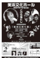
2007年 こけら落とし公演 「美浜に吹く風」 総合演出：横内謙介