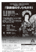
2009年 市民歌舞伎 「歌舞伎のタノシミカタ」 総合演出：横内謙介