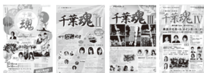
2012年~2015年 市民参加型創作劇 「千葉魂 (Chiba Soul) I~IV」 ステージ監修：横内謙介/演出：鈴木里沙(劇団扉座) 2012年の会館5周年記念を皮切りに4シリーズを制作。千葉魂IVには六角精児も出演