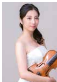
大塚百合菜 (ヴァイオリン)