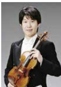
山岸努 (ヴァイオリン)